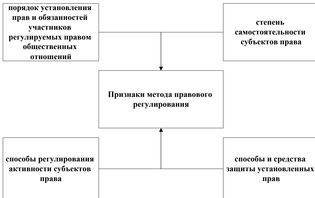
Рис. 2. Признаки метода правового регулирования

составляющих предмет соответствующей отрасли права, представленный на рисунке 2.