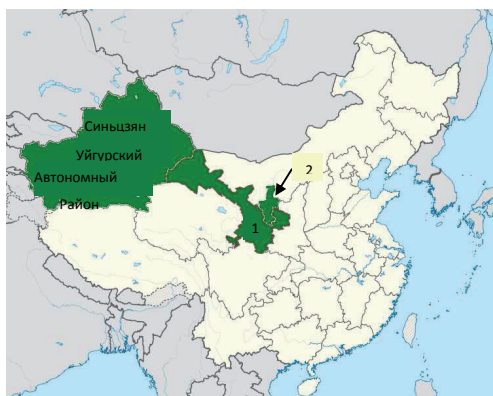
Рис.1 Основные районы преимущественного расселения народов КНР, исповедующих ислам 4

Востока и Запада. В конце IX века и начале X века в южные районы современного Синьцзяна из Средней Азии проник ислам. 1 Под воздействием религиозных проповедников уйгуры и большая часть других тюркских народностей начали принимать ислам. «Ислам стал главной религией уйгуров и других национальностей, в Синьцзяне». 2 Оттуда, вместе с торговцами произошло быстрое распространение суннитского течения мусульманства, не только в Северо-западных районах Китая, но и во внутренних его провинциях. 3